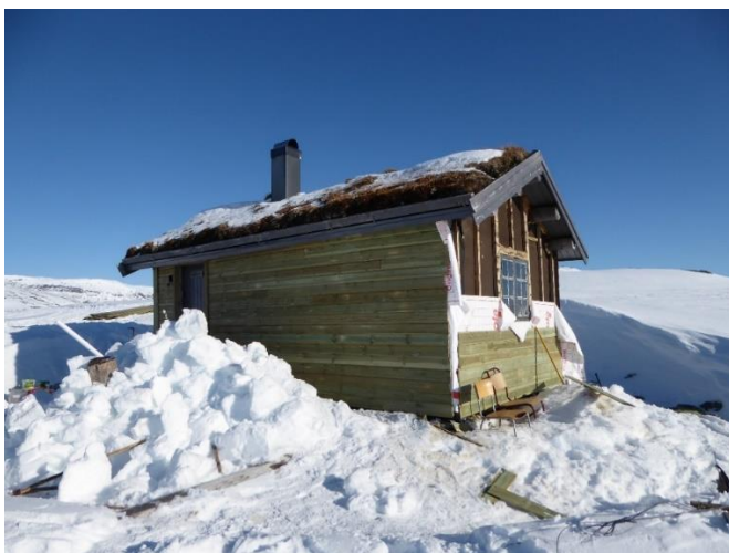
Figur 1. Det blei skifta kledning på Ripsebu i 2021.

Lavvoen ved Langavatnet til fri bruk for fiskarar og andre blei sett opp i 2021.