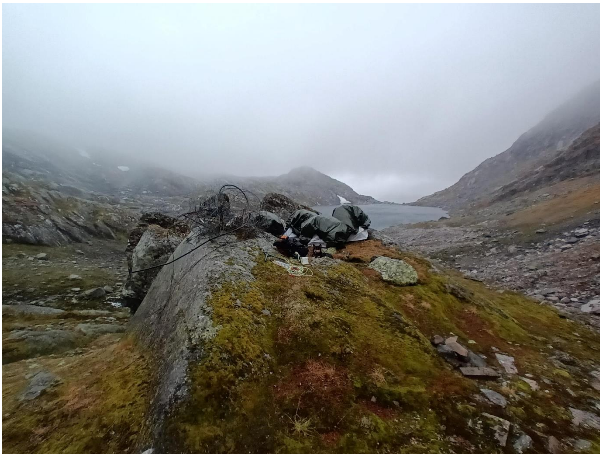
Figur 2: Opprydding av rape ved Reinstjødna i oktober 2023.