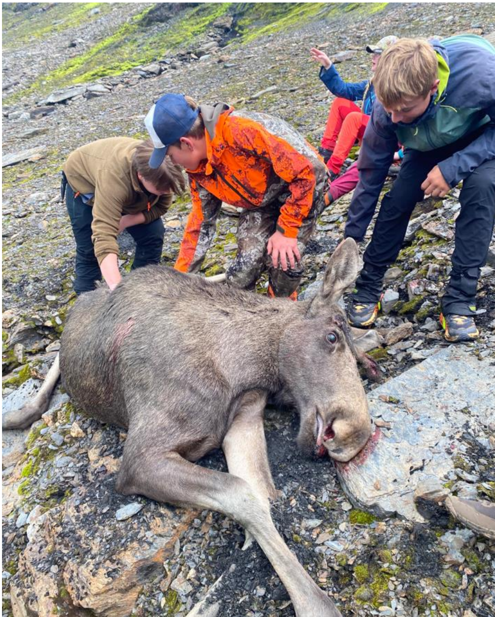
Figur 1: Rekrutteringstur med Røldal skule til Hedlevass