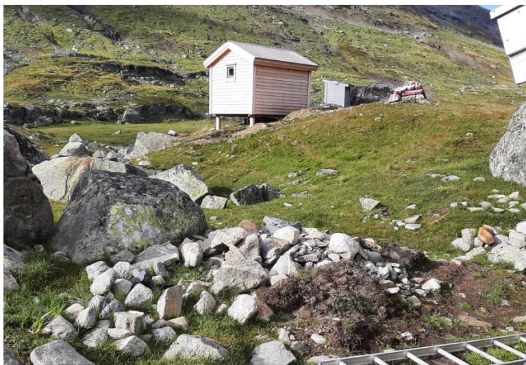
Figur 3: Nybygg på Ninive

Det står att ein del utearbeid rundt hytta og uthuset.