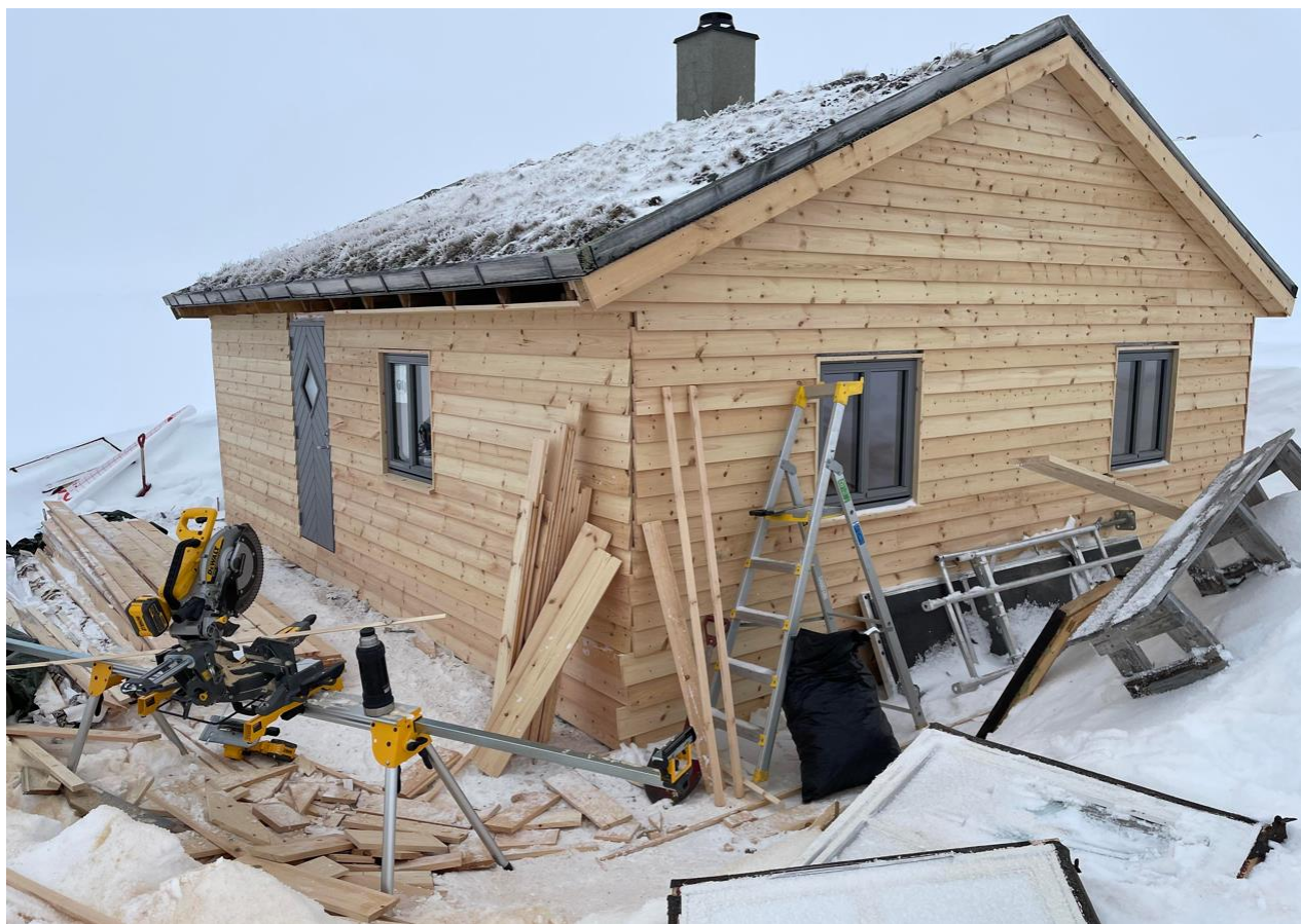
Figur 4: Nesten ferdig med utvendig renovering

Ein oppgraderte i tillegg solcelleanlegget, til eit moderne anlegg. I løpet av seinsommaren vart det gjennomført ein vaskedugnad, samtidig som ein klargjorde hytta til jakta.