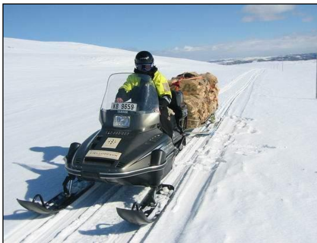
Fjelloppsynet forsyner fjellstyrehyttene med brensel.