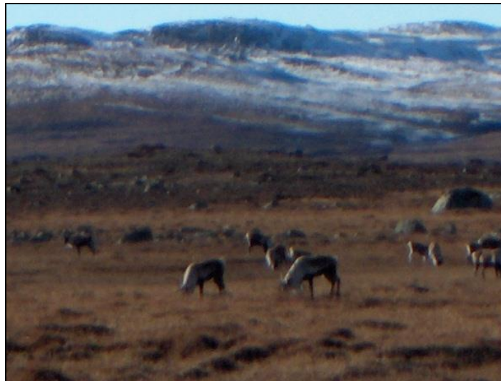
Villrein på Saurflott under strukturtellinga hausten 2004.

Fjellopsynet har vedlikehelde gjerdene i eit husdyrbeitestudie på oppdrag frå Universitetet i Oslo .